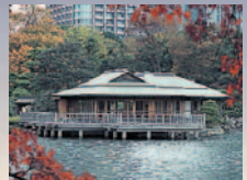
潮入の池と中島の御茶屋