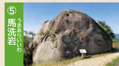
⑤ 馬洗石 この岩の上に馬を乗せて洗ったと言い伝えられる、周囲 45m程の自然石です。