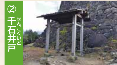
② 千石井戸 天守近くにある井戸です。今でも水が湧き出ています。