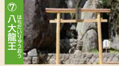
⑦ 八大龍王 遠山家の守り神。明治時代に現在の場所に据えられました。