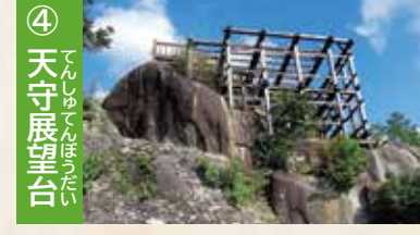
④ 天守展望台 天守の柱があった穴を再利用した展望台からは、美しい景色が見渡せます。