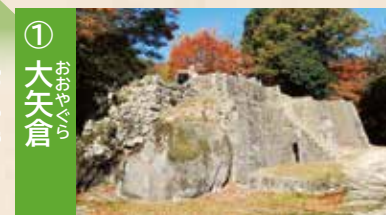
① 大矢倉 三階建ての大きな矢倉。御鳩小屋とも呼ばれていました。