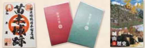
苗木城跡御城印 御城印帳 苗木城跡資料「城山と歴史」

苗木遠山史料館では、苗木城跡に関するお土産物や資料集なども販売。来城記念にいかがですか。