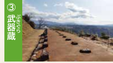
③ 武器蔵 鉄砲や弓等の武器蔵で、礎石や縁石は当時のまま残されています。