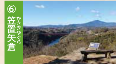
⑥ 笠置矢倉 笠置山に向かって設置された物見矢倉です。絶景が楽しめます。