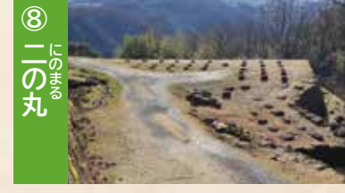
⑧ 二の丸 領主遠山家の住居や家臣が集まる部屋がありました。

View Point あしがらながや 足軽長屋からの眺望 かつては、足軽の長屋(詰所)があった場所。天守跡と恵那山を同時に望め、写真撮影にオススメです。