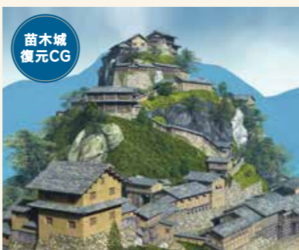
イメージCG 浅野孝司氏制作

ところが、またも黒い雲が現れ、激しい雨が降り、雷が鳴り始めました。すると、お城の麓の木曾川から龍が現れ、お城をいくえにも巻き、鋭い爪でガリガリと白壁を削ぎ取ってしまったのです。やがて龍は姿を消し、お城はすっかりもとの赤壁に戻りました。以降、苗木城は赤壁のままにされ、赤壁城と呼ばれるようになりました。