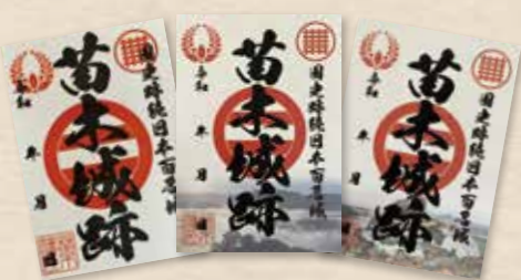
ステッカータイプの3種類の御城印 左から通常版、霞ヶ城、赤壁城 (各800円)