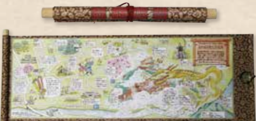
表面には苗木城跡の写真と説明、裏面には赤壁城伝説と周辺の見所をイラストで紹介 (500円)