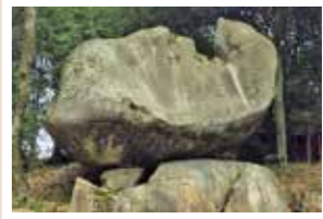
ふな岩(丸山神社内)