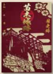
天守展望台の切り絵をあしらった御城印。 深みのあるえんじと緑色の2種類 (各800円)