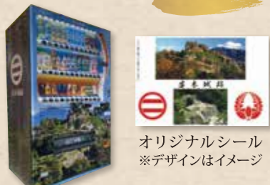
オリジナルシール ※デザインはイメージ

御城印の通常版は、A1駐車場に設置されている自販機で常時購入できます。(オリジナルシール付きで500円)